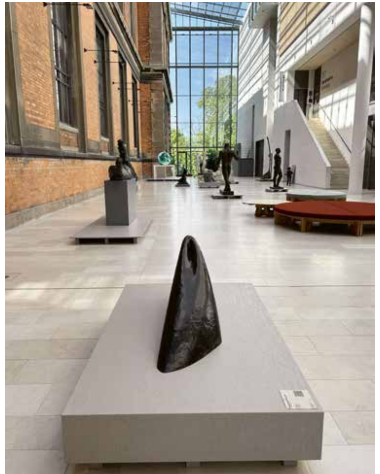
3 Sonja Ferlov Mancobas Skulptur 1940–1946 in der Dauerausstellung des Statens Museum for Kunst, Kopenhagen, 2024

Der rumänische Bildhauer Brâncuși war 1904 nach Paris gekommen und wurde um 1910 durch seine extrem reduzierte Bildsprache bekannt, die um wenige Themen und gegenständliche Assoziationen kreiste: archetypische Figurationen; das Motiv des