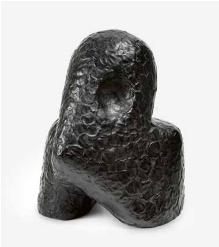
8 (Kat. 23) Sonja Ferlov Mancoba: Den lille nænsomme / Die kleine Sanftmütige , 1951, Estate Ferlov Mancoba (vgl. Kat. 8)

Eine der Maskenskulpturen des Jahres 1939, Maske (Krigens udbrud) / Maske (Ausbruch des Krieges) (Abb. 7 und Kat. 6), führt die Unmittelbarkeit der politisch motivierten Wende im Werk Mancobas bereits im Titel. Ohne in artistische, materielle oder gestalterische Finessen auszuweichen, geht die Künstlerin in diesem Werk direkt auf die unmittelbar physische, sensorische und mentale Bedrohung durch das heraufziehende Kriegsgeschehen ein, das Individualität, Klassen- oder ethnische Zugehörigkeit auflöst und den Menschen in einen Zustand der Erstarrung versetzt. Verschiedene Interpreten des Werkes von Mancoba haben mögliche Anregungen für ihre Bildfindung identifiziert, aus Antike, außereuropäischer Kunst, aber auch von Künstlern ihrer Zeit wie Jacques Lipschitz und Max Ernst. 17 Ohne Zweifel befindet sich Mancoba hier in einem inneren Dialog mit verschiedensten historischen und zeitlich parallelen Zeugnissen. Zugleich sprechen ihre Werke in der unauflösbaren Verschränkung von Aggression und Schrecken, von Schrei und Anrufung, eine ganz eigene Sprache. 18