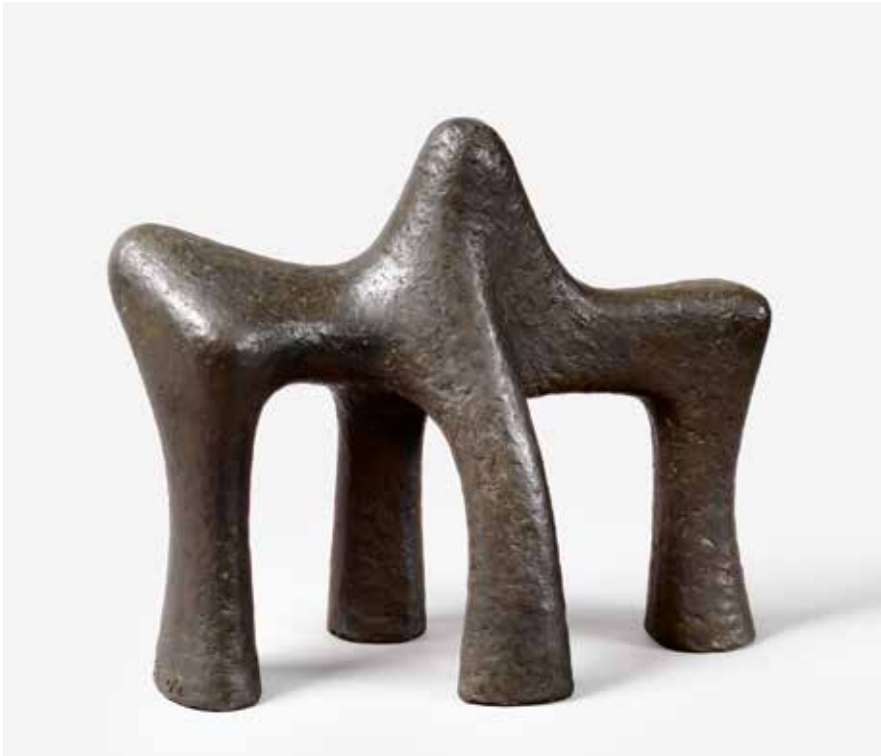
15 A l'écoute du silence / Der Stille lauschen (Hommage à Steingrim Laursen), 1969 29,5 × 15,5 × 34,5 cm, Bronze Estate Ferlov Mancoba