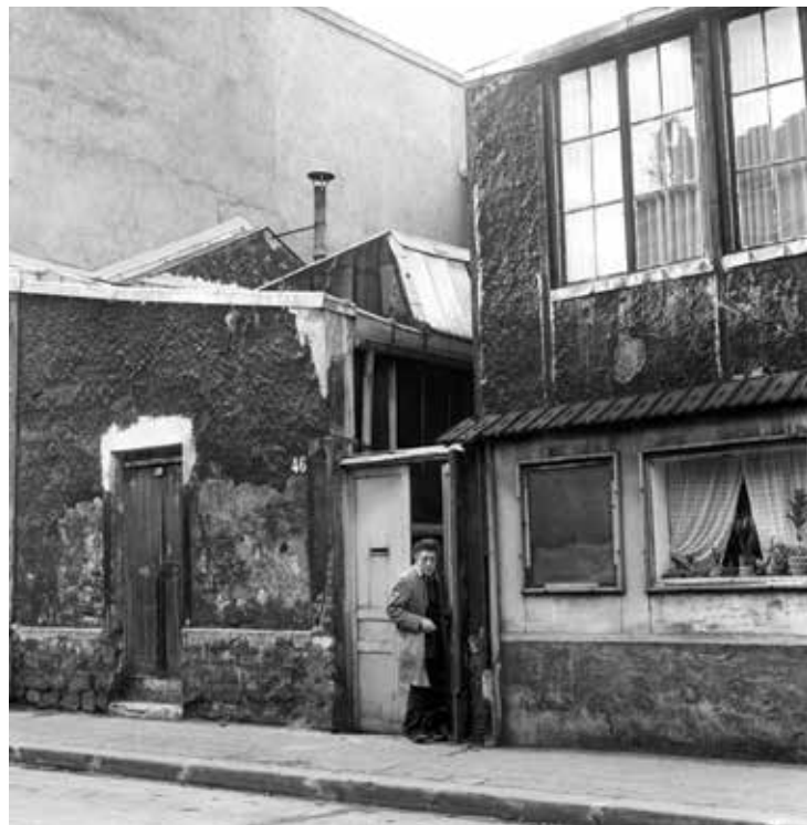
1 Alberto Giacometti vor der Tür seines Ateliers in der Rue Hippolyte Maindron 46, Paris, 1960. In der oberen Etage hatte Ernest Mancoba 1938 sein Atelier bezogen.

Paris. Das Kriegsjahr 1940. Die politische Situation in der französischen Metropole ist, seit der deutschen Besetzung im Juni des Jahres, geprägt von Unterdrückung, Angst und wachsender Verfolgung. Für Menschen aus anderen Ländern ist die Stadt, die einst als Ort der Freiheit, Kreativität und Weltoffenheit galt, zu einem gefährlichen Terrain geworden. Die Lage für ausländische Künstler:innen und für Intellektuelle ist prekär. Doch unter der Besetzung wird die Avantgarde als subversiv betrachtet, sie ist konfrontiert mit Repression und Gewalt. Menschen sind gezwungen zu fliehen oder im Untergrund zu überleben. Viele Künstler:innen aus dem Kreis der Surrealist:innen um André Breton und Marcel Duchamp sind bereits auf dem Weg ins Exil. Galerien und Museen werden unter Aufsicht gestellt, Werke aus jüdischen Sammlungen oder als subversiv eingestufte Arbeiten werden beschlagnahmt.