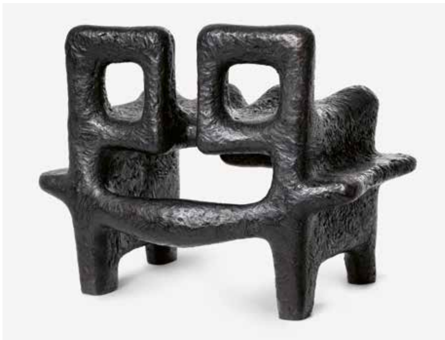
12 (Kat. 26) Sonja Ferlov Mancoba: Vogtere af vor arv / Hüter unseres Erbes , 1973, Estate Ferlov Mancoba

Maske og figur / Maske und Figur (1977-1984, Kat. 19) bildet den Abschluss der bereits 1939/40 begonnenen großen Gruppe der Maskenskulpturen. Was die Künstlerin in den Jahrzehnten zuvor eher getrennt untersucht hatte – die archaische Reduktion der Themen „Maske“ und „Figur“ – tritt hier als gleichsam dual aufgelöste Einheit zusammen. Eine angedeutete Figur mit einer Art Krone auf dem Kopf hält vor sich eine große Maske als ein „zweites“ Gesicht. Die Skulptur hat formal wie hinsichtlich ihrer dominanten Größe eine durchaus „archaisch“ anmutende Ausstrahlung von Gewalt und Schrecken. Auch für dieses in seiner räumlichen und physischen Ausstrahlung singuläre Werk gilt ebenso wie für das gesamte Schaffen der Künstlerin: Sonja Ferlov Mancobas Figuren, Körper, Gesichter und Masken bewahren eine überindividuelle Ausstrahlung und universelle Ausdruckskraft, Qualitäten, die sich in der Zeit nicht zu verorten scheinen. Und doch reflektieren sie die wechselnden Lichten und Dunkelheiten der politischen und gesellschaftlichen Dramen des 20. Jahrhunderts.