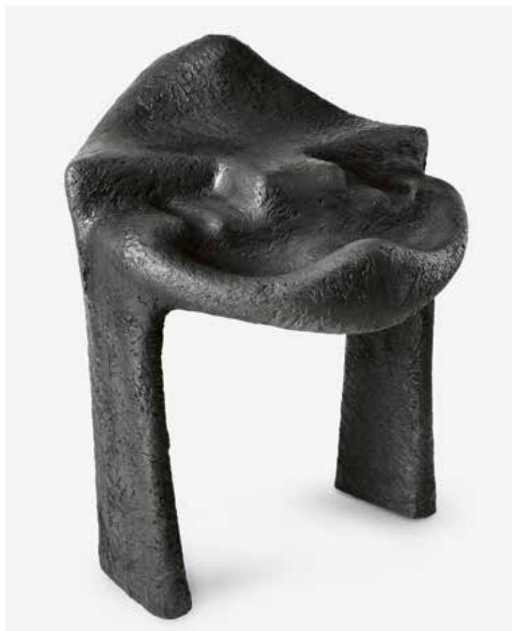
11 (Kat. 25) Sonja Ferlov Mancoba: Maske (auch: Table Mask / Tisch-Maske ), 1965–1975, Estate Ferlov Mancoba

Auch die derbe, Schrecken erregende Physiognomie der Maske (auch: Table Mask / Tisch-Maske ), 1965–1975 (Abb. 11) sowie das stuhlähnliche Objekt selbst knüpfen an Praktiken des Schamanismus an. Stuhl- oder tischähnliche Objekte mit Maskenmotiven sind ein ritueller oder symbolischer Gegenstand in verschiedenen kulturellen Kontexten. Die groben Gesichtszüge können die eines Toten oder einer spirituellen Kraft sein oder als eine Art Spiegel verstanden werden. Als Objekt dient der Stuhl