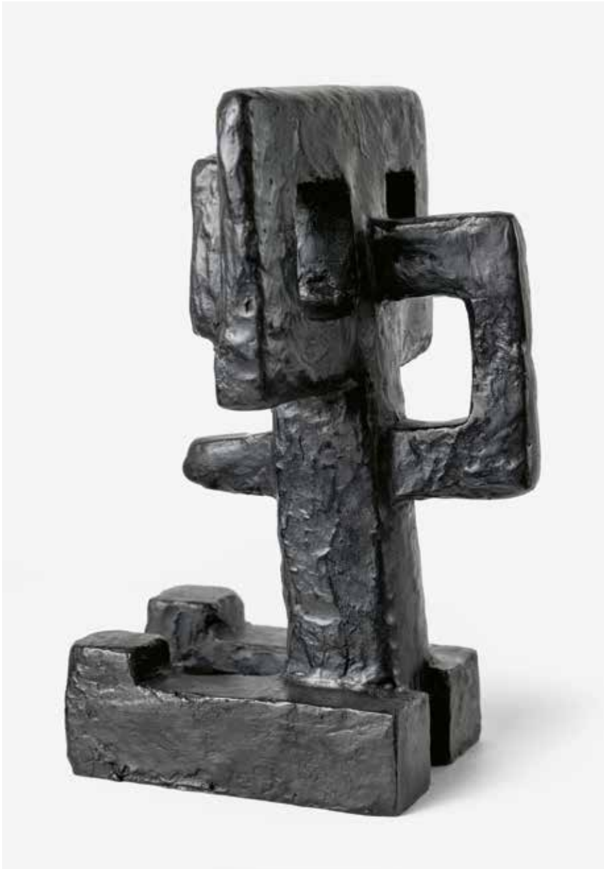
4 Skulptur (ohne Titel), 1938/39 28 × 20 × 12,5 cm, Bronze Estate Ferlov Mancoba