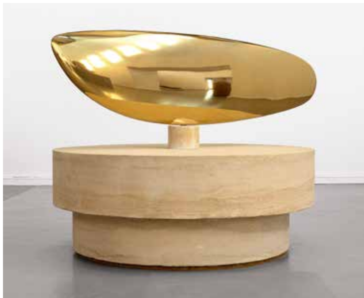
4 Constantin Brâncuși: Le grand poisson / Der große Fisch , 1930, Kunsthalle Mannheim, Leihgabe des Landes Baden-Württemberg seit 1969

Nicht minder bedeutsam für die junge Künstlerin in Paris war, gleich nach ihrer Ankunft 1936/37, die persönliche Begegnung mit Alberto Giacometti, dessen Werke sie in den Jahren zuvor ebenfalls in Kunstmagazinen hatte bewundern können. Doch der erste Besuch in seinem Atelier (Abb. 5), gemeinsam mit dänischen Künstlerfreunden, bringt Überraschungen mit sich, da Giacometti sein surrealistisches Werk abgebrochen und sich der Arbeit mit Modellen seines Umfeldes zugewandt hatte: