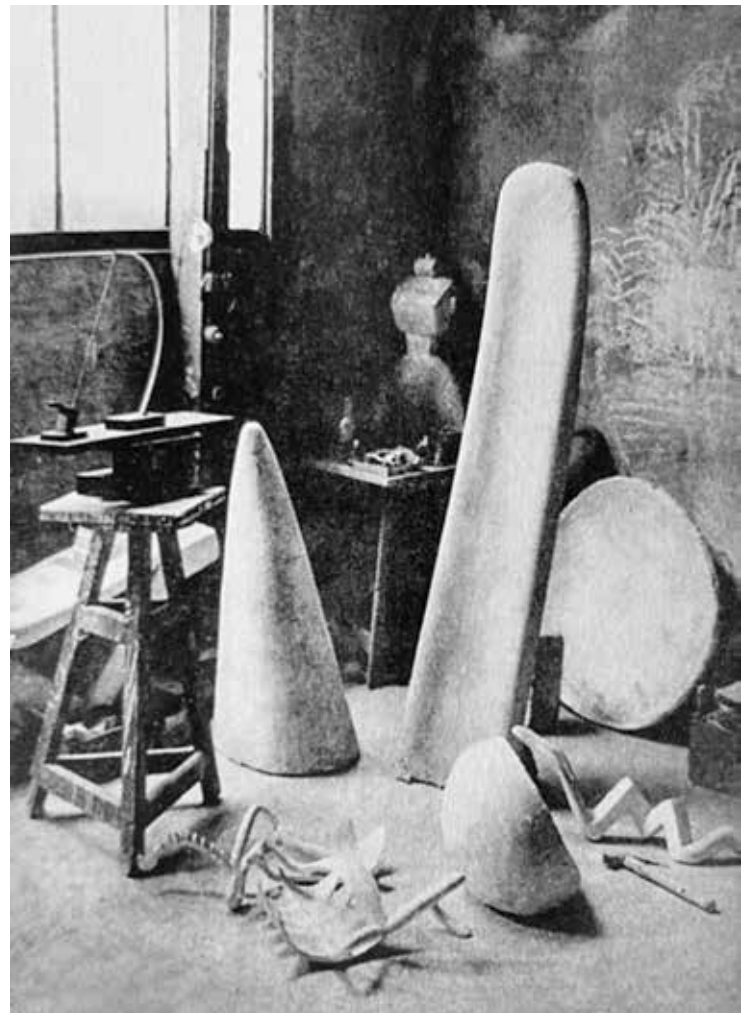
5 Das Atelier von Alberto Giacometti in der Rue Hippolyte Maindron 46, Paris, 1932, Foto: Brassai

„Natürlich hatten wir uns bereits ein Bild von Giacometti als Bildhauer gemacht (aufgrund von Reproduktionen seiner Werke). Daher war es für uns, die wir in den Surrealismus und die abstrakte Kunst eingetaucht waren, ein gewisser Schock, als wir feststellten, dass Giacometti mit winzigen Köpfen arbeitete, die tief geritzt und mit vielen Linien und kleinen erhabenen Partien ausgeführt waren. Doch überall im Raum fanden wir zu unserer Erleichterung und großen Freude all die Dinge, von denen wir geträumt hatten (und von denen viele einfach nur herumlagen) [...]. Es war ein großer Moment für uns alle vier, in diesem Raum herrschte eine Atmosphäre, die für uns völlig neu war. Es wurden Fragen gestellt und Antworten gegeben. Giacometti war