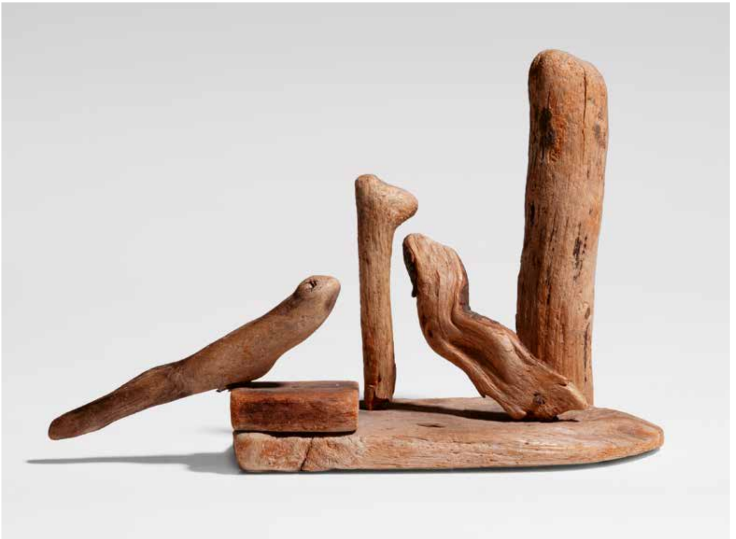
1 Levende grene / Lebende Zweige , 1935 10 × 29 × 12,5 cm, Holz Museum Jorn, Silkeborg, Inv. 2008/0074