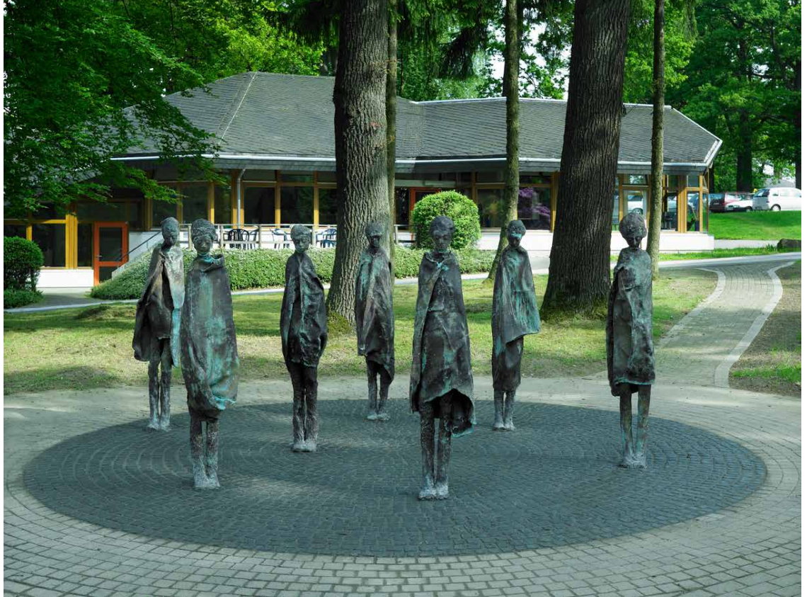
Ariane von Mauerstetten, Monaden , 2008, Bronzeguss patiniert 7-teilig 168 x 380 x 380 cm, Evangelische Stiftung Tannenhof, Remscheid

Mit dem über zwei Jahrzehnte entstandenen und rund 2500 Werknummern zählenden Oeuvre der Bildhauerin und Zeichnerin Ariane von Mauerstetten ist eine künstlerische Position wiederzuentdecken, die in vielfältiger Weise in die Kunstentwicklung der 1990er / 2000er Jahre eingebunden war. Die Plastiken, Skulpturenensemble und Zeichnungssuiten der Künstlerin formulieren eine explizite, provokante und schonungslose Inhaltlichkeit und Ästhetik, die in einer reflektierten Auseinandersetzung zu Fragen von Weiblichkeit und Identität gründet.